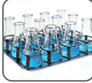
Erlen tutucu ile birlikte platform MP100-12