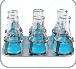
Erlen tutucu ile birlikte platform MP250-6