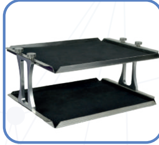
Çift katlı Düz platform Kaymaz kauçuk mat ile birlikte MP-RM-4D