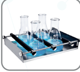
Universal platform, Ayarlanabilir bar ile birlikte MUP-12