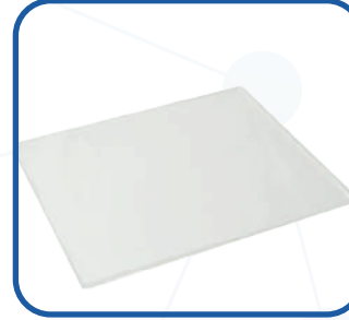
Yapışkan(Sticky) ped MSP-STC MP-RM-4 yada MP-RM-4D ile birlikte kullanılabilir